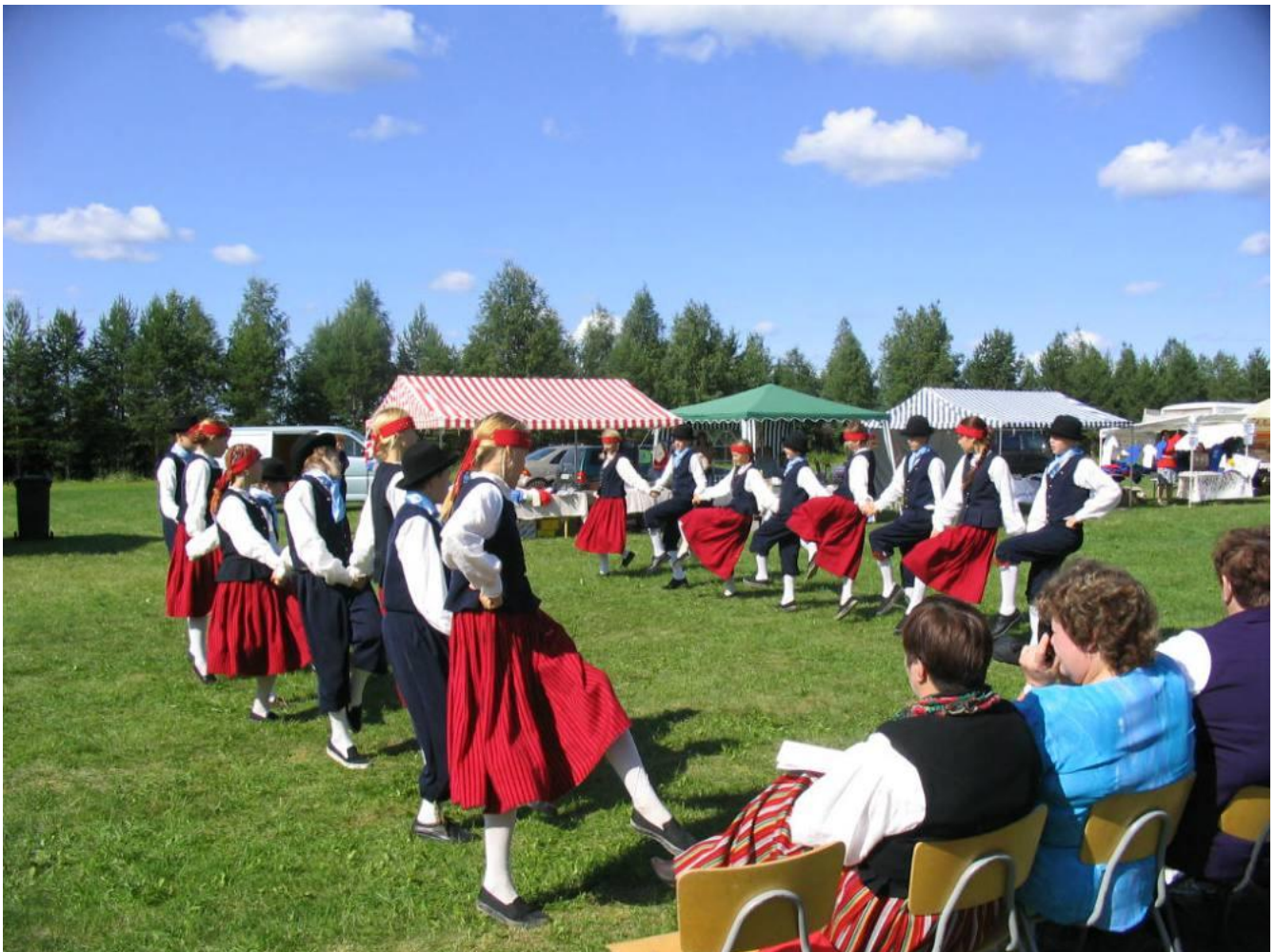
Lohijärvi 2004, vieraita Virosta